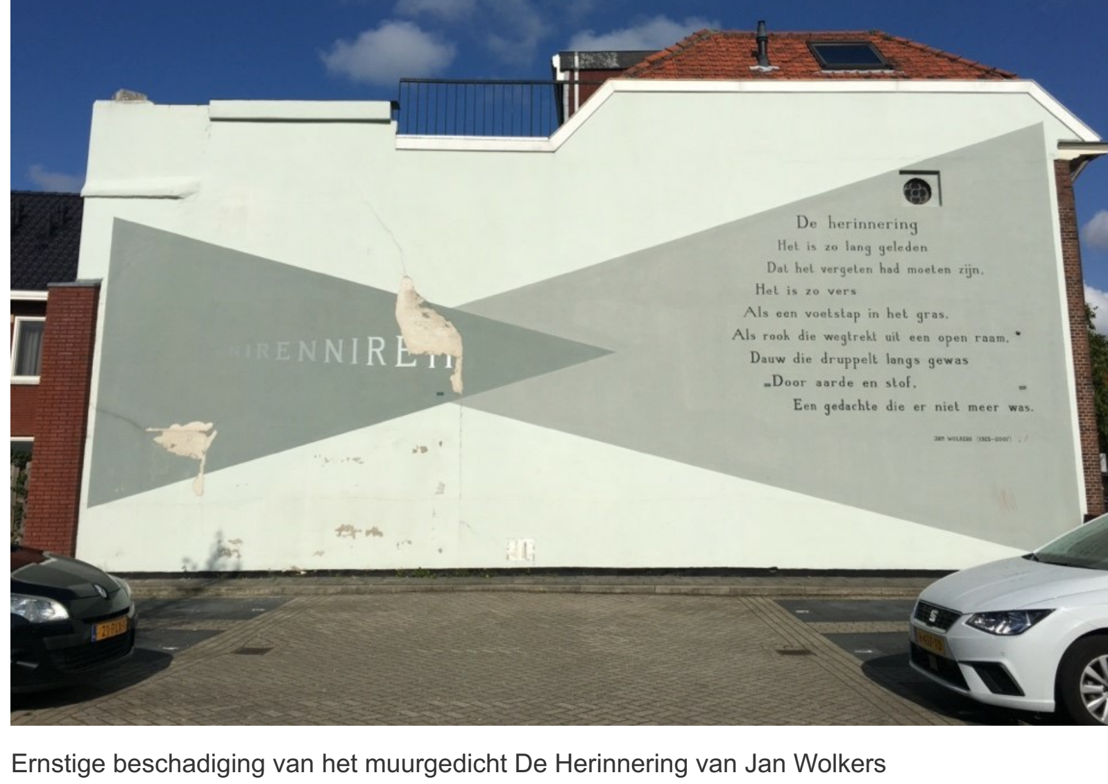
Ernstige beschadiging van het muurgedicht De Herinnering van Jan Wolkers

Als we weten wat de kosten zijn houden we een crowdfunding. Dit verlies raakt immers iedereen in het dorp: hier is de culturele identiteit van het dorp in het geding. Cultuurfonds Oegstgeest goopt de voorkeur aan een positieve boodschap, maar we vertrouwen erop dat die er zal komen. We werken eraan. Wordt vervolgd.